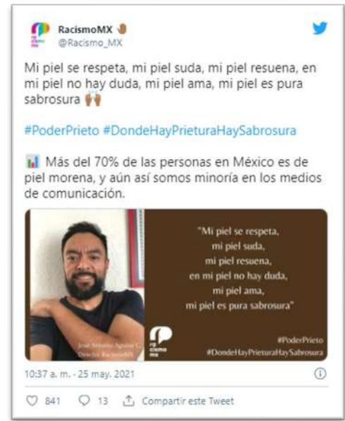
(26 de mayo de 2021) #Poderprieto. La campaña que delata el racismo en México Animal MX. Recuperado el 31 de mayo de 2021 https://animal.mx/2021/05/racismo-mexico-poder-prieto/

(8) Desde hace varios meses, algunos actores y actrices mexicanos han denunciado actos de discriminación en su contra dentro de la industria del cine y la televisión. Por eso es que algunas de estas figuras fueron de los primeros en unirse a Poder Prieto en contra del racismo en México.