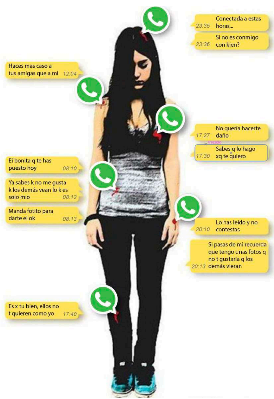
(agosto 2015). Cartel de la Comunidad de Madrid. Programa de atención para adolescentes víctimas de violencia de género. Retomado el 1 de junio de 2023 de http://centrodela mujeraguilas.blogspot.com/2015/08/no-es-amor-identificalo.html